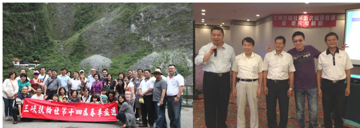
↑春季旅遊~太魯閣國家公園